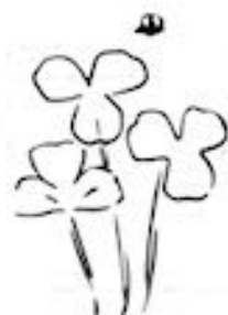
【障害福祉サービス事業所 ル・リアン】〔岐阜市川部6丁目60番地〕