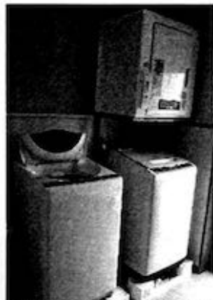
保護者会・後援会様寄贈 洗濯機・乾燥機