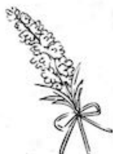
【グループホーム ル・リアン】〔岐阜市下西郷5丁目66番地1〕