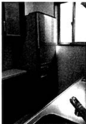
保護者会・後援会様寄贈 冷蔵庫