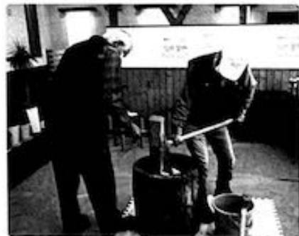
至誠会役員の皆さん