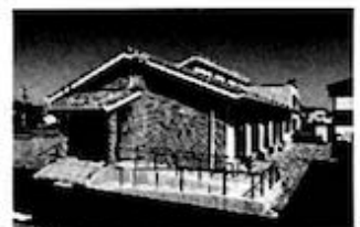
グループホーム ル・リアン