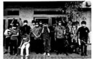
短期入所棟・従たる事業所[下西郷5丁目65番1(借家)]の指定を受け利用者の一部活動場所として事業を始めた。