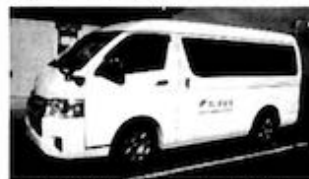
共同募金送迎車 赤い羽根号