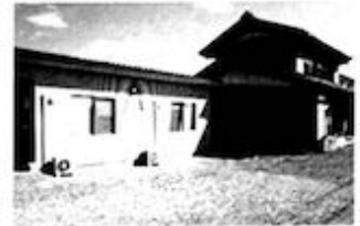
短期入所棟・従たる事業所下西郷 改修