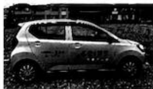
東海テレビ愛の鈴号