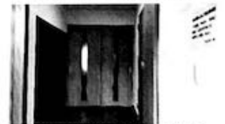
従たる事業所下西郷 改修