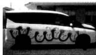
日本財団助成送迎車両